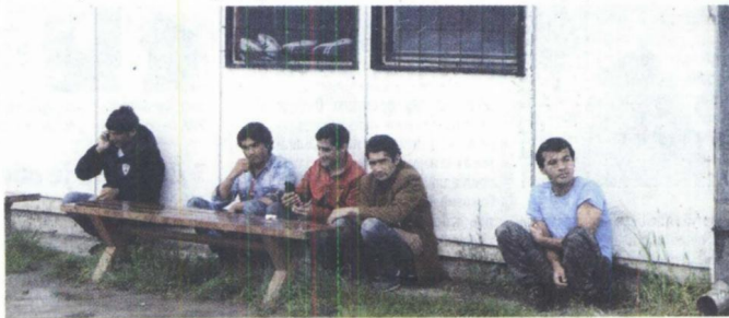
ИШЧЕКИВАЊЕ Колективни центар у Крњачи, у Београду

Конкурс је отворен као део Регионалног програма стамбеног збрињавања избеглица, чији циљ је да стави тачку на избегличку причу у региону и да збрине све оне који још немају свој кров над главом. Конкурс објављен у Београду, на чију ранг-листу се чека готово годину дана, само је један