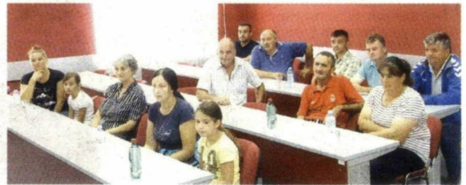
Избегличке породице којима је додељена помоћ

-Ми смо помогли тај пројекат и увек ћемо помоћи, јер нам је веома драго када се дешавају овакве лепе ствари, а не неке друге. Општина Шид не брине само о мигрантима, него нам је на првом месту брига о нашем