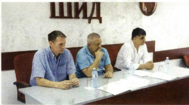
Уручивање уговора у сали СО

Средства за реализацију ова два пројекта, а реч је о више од пет милиона динара, обезбеђена су из републичког буџета преко Комесаријата за избеглице и миграције, уз учешће Општине Шид