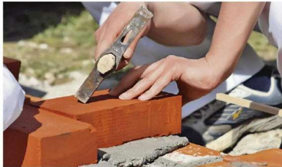
Изградња станова требало би да почне почетком 2017. године

ИЗБЕГЛА ЛИЦА КОНКУРИСАЛА ЗА СТАНОВЕ С НЕПОТПУНОМ ДОКУМЕНТАЦИЈОМ